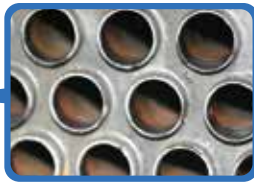
本製品を使用した 吸収式冷凍機チューブの様子